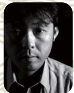
あに (情景作家・MODELER'S DEPRESSION)

お題が妖怪ということですが、実在しないものほど、個人の発想や感性を出しやすいモチーフはありません。ジオラマ好きの自分としてはキャラクター性と状況が分かるような、天狗を引き立てるジオラマ仕立ての作品のエントリーを期待しています。