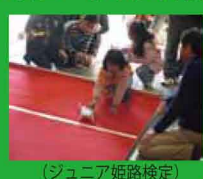
(ジュニア姫路検定)