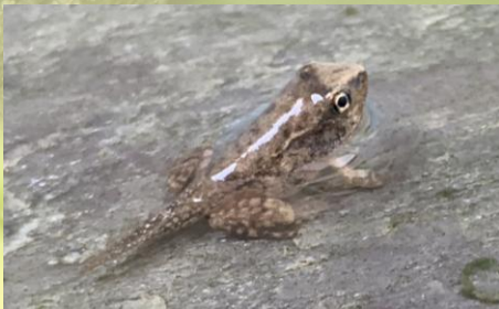
ニホンアカガエルの幼体