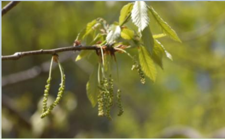
コナラ（どんぐりの木）の花