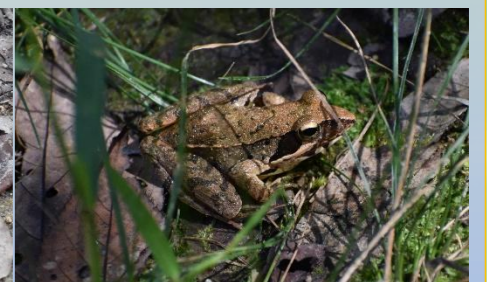
ニホンアカガエル