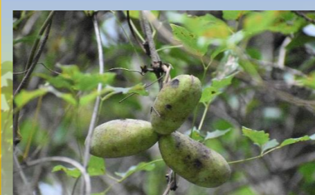
ミツバアケビの実