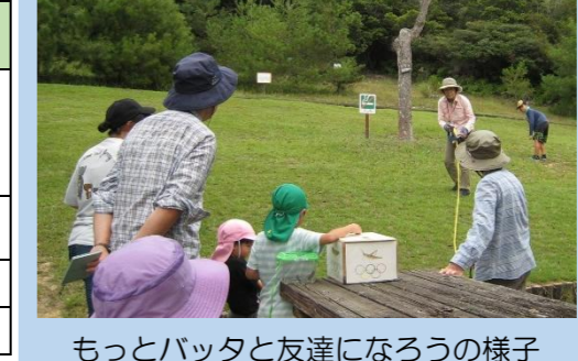
もっとバッタと友達になろうの様子