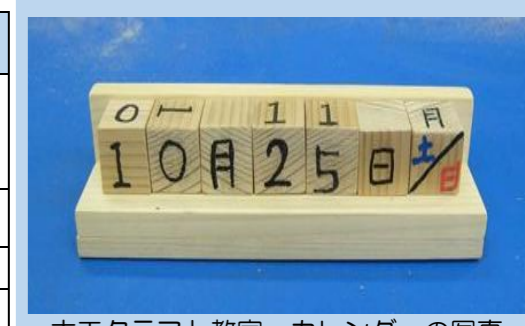
木工クラフト教室 カレンダーの写真