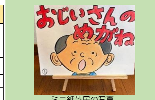
ミニ紙芝居の写真