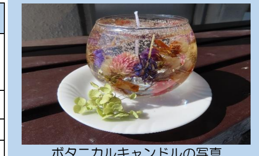
ポタニカルキャンドルの写真