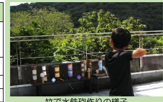
竹で水鉄砲作りの様子