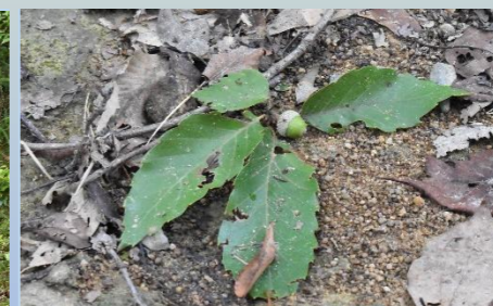
ハイイロチョッキリのおとしもの