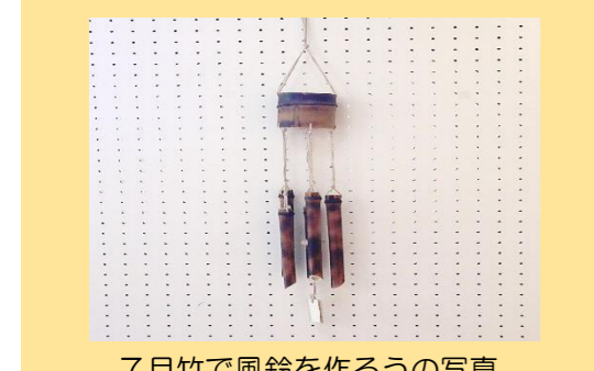
7月竹で風鈴を作ろうの写真